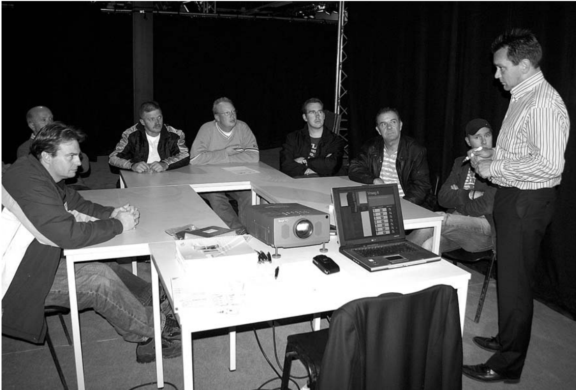
Foto links: BVR-medewerkers luisteren aandachtig naar de informatie die zij van de KPE-instructeur (geheel rechts) krijgen.